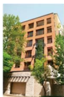
آرام و نجیب